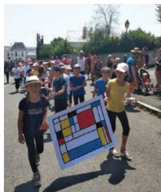
La kermesse sur le thème des Arts