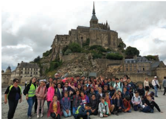
Séjour des CE2-CM à Saint-Malo