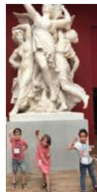
Sortie au musée des Beaux-Arts