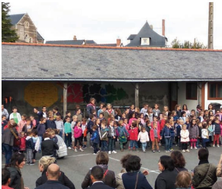
Fête de la rentrée avec les parents