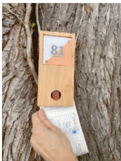
Balise à poinçonner