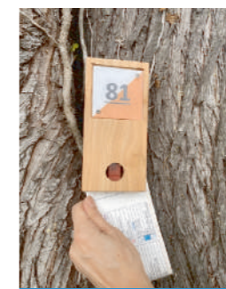
Balise à poinçonner