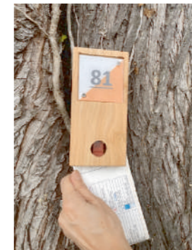
Balise à poinçonner