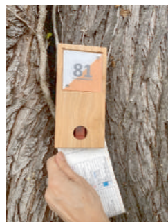
Balise à poinçonner